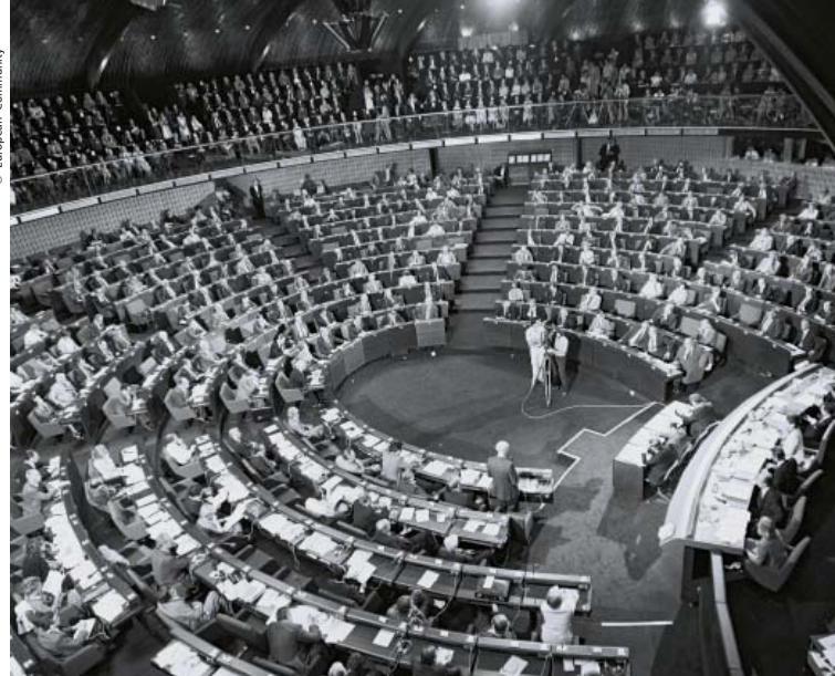
Primera sesión del PE tras su elección por sufragio Universal en 1979.

Siguiendo el principio de transparencia de las Instituciones comunitarias, cualquier ciudadano puede conocer el perfil político y los trabajos desarrollados por cada uno de los eurodiputados, conocer cómo participan en la vida parlamentaria, comunicarse con ellos a través de su correo electrónico, teléfono o incluso debatir con ellos a través de los blogs que algunos eurodiputados mantienen. Se puede también conocer el orden del día de los plenos, seguir