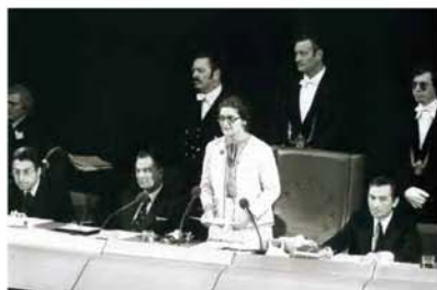
Simone Veil, primera presidenta del Parlamento Europeo.

peticiones de ciudadanos al Parlamento y los temas tratados por esta institución en defensa de los intereses de los ciudadanos europeos. Europa Joven: Noticias del PE dirigidas al