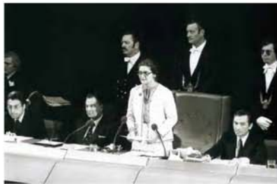
Simone Veil, primera presidenta del Parlamento Europeo.

peticiones de ciudadanos al Parlamento y los temas tratados por esta institución en defensa de los intereses de los ciudadanos europeos. Europa Joven: Noticias del PE dirigidas al