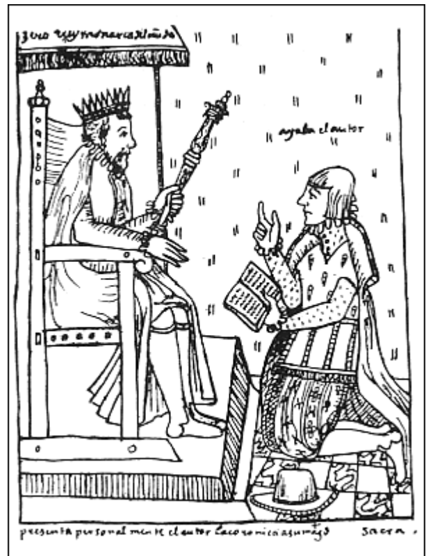
PRESENTACIÓN DE LA NUEVA CORÓNICA DE AYALA AL REY

Felipe Guamán Poma de Ayala presenta personalmente a la Sacra Católica Real Majestad, Felipe III de España, su libro Nueva Corónica y Buen Gobierno deste Reino del Perú , con el deseo de llegar a una "verdadera" reconciliación entre conquistados y conquistadores, llamados a convivir juntos y a necesitarse mutuamente