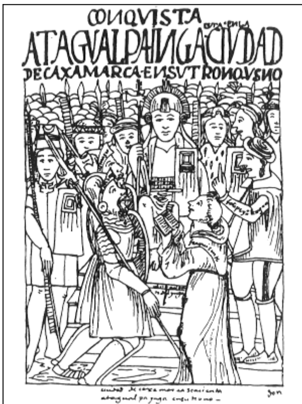
FRAY VICENTE DE VALVERDE LEE EL REQUERIMIENTO AL INKA ATAHUALPA EN LA CIUDAD DE CAJAMARCA

En la polémica política y religiosa del siglo XVII, Juan de Solórzano Pereira, consejero y defensor oficial de la Corona española, es un punto de partida para la reivindicación formal y liberal de los derechos de los indios. Pero a la vez es también un punto de vuelta a los principios medievales del "Dominus Orbis", principios que parecían definitivamente superados por la Escuela de Salamanca. Esta interpretación histórica fue posteriormente recurrida por enciclopedistas e independentistas americanos. La verdad política de América es la clave y el último resultado de la defensa oficial del doctor y abogado Juan de Solórzano Pereira contra la acusación de Europa a la Corona española. Era otra forma de manipulación histórica.