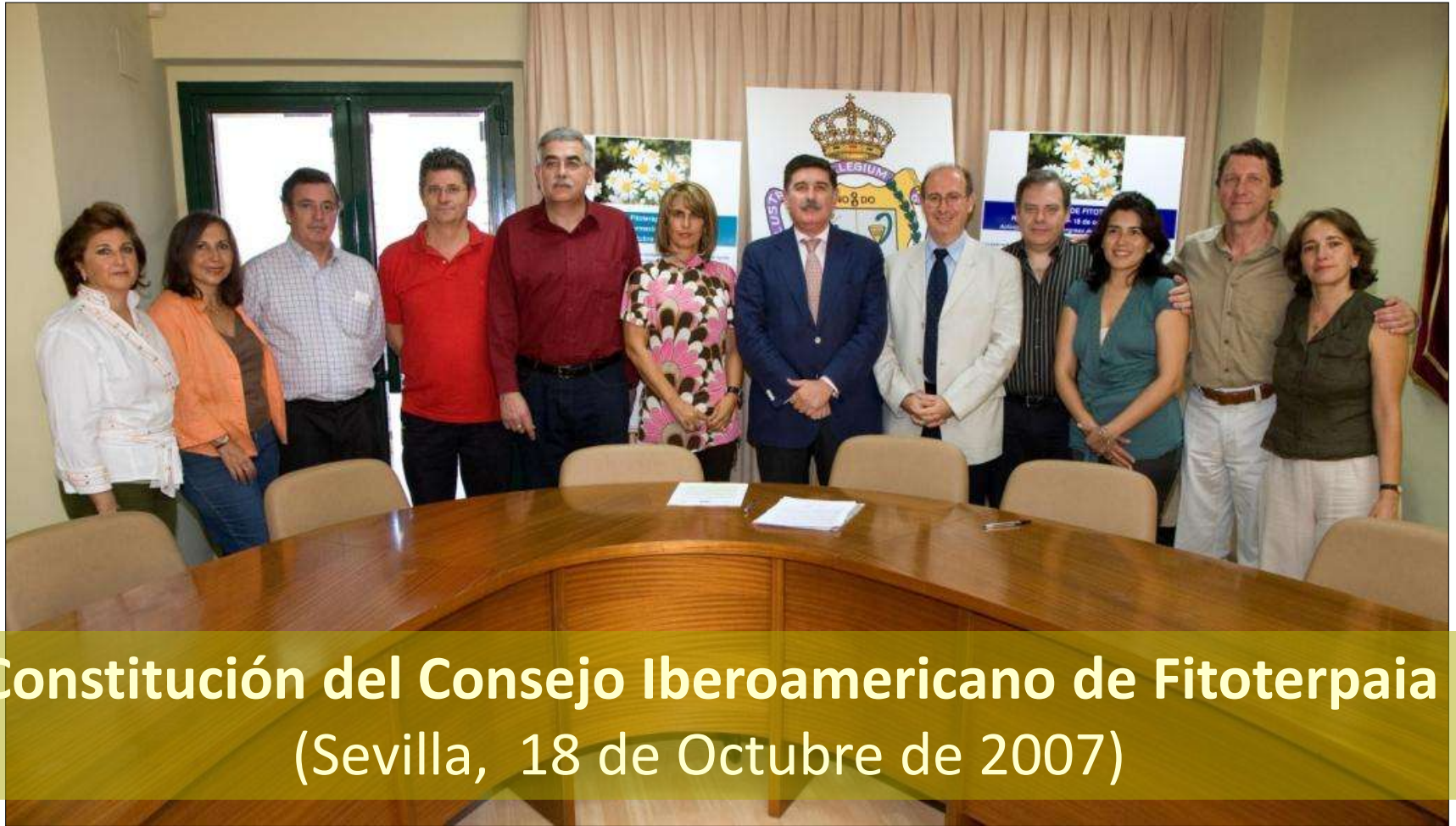
Constitución del Consejo Iberoamericano de Fitoterapia (Sevilla, 18 de Octubre de 2007)